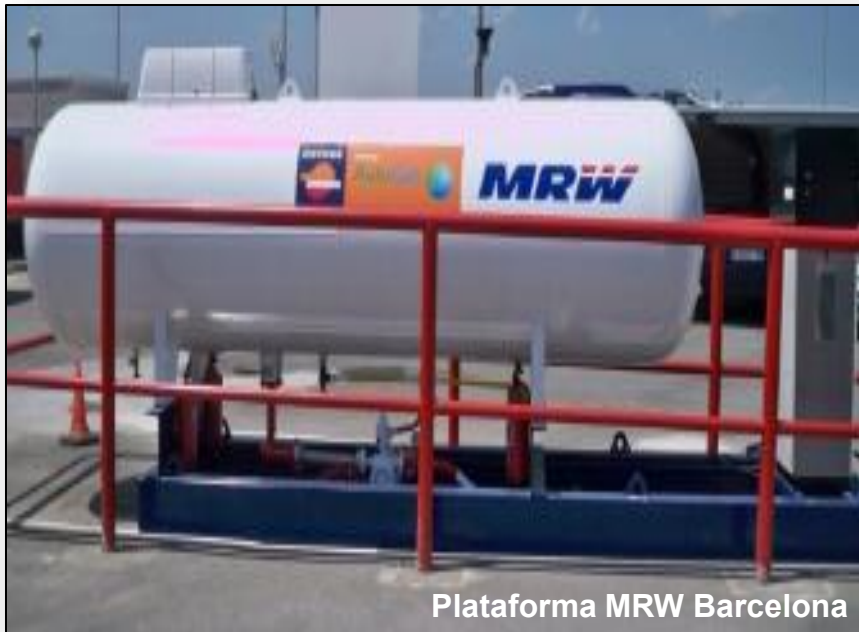
Plataforma MRW Barcelona