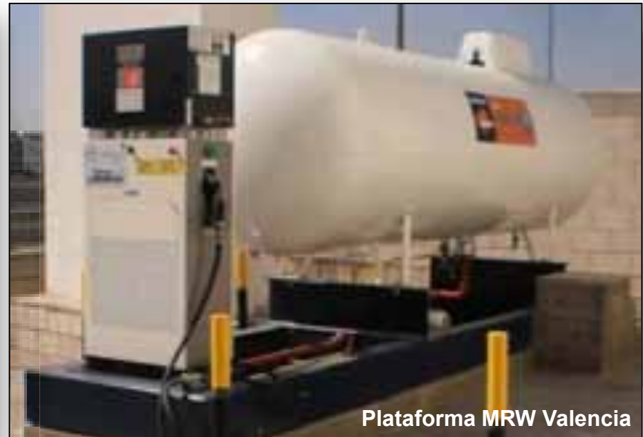
Plataforma MRW Valencia